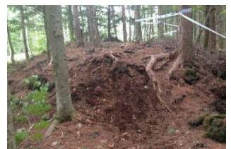
〈ダークボルケーノ〉

シングルトラックの中に連続バームやテーブルトップ、ドロップオフなどのアイテムが詰まった縦と横の動きが気持ちの良いふじてんの名物コース。路面のバリエーションも様々なので上級者まで幅広く楽しむ事が出来る。